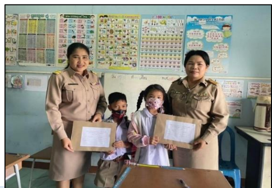
รายงานผลการพัฒนาข้าราชการครูและบุคลากรทางการศึกษา ประจำปีงบประมาณ พ.ศ.๒๕๖๖