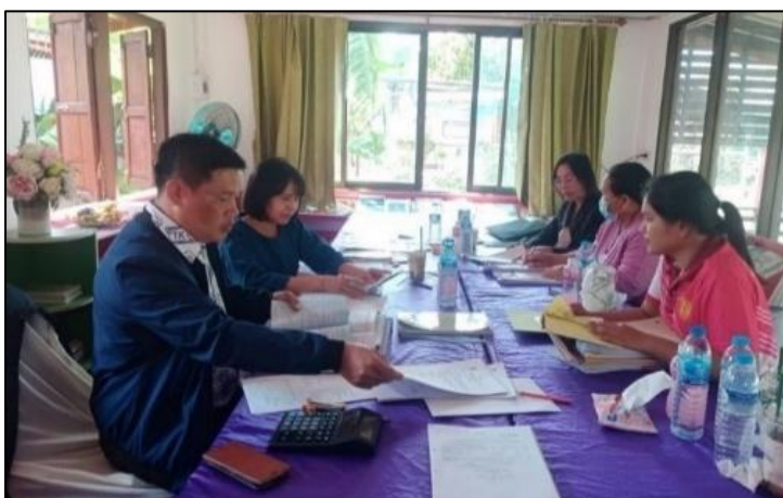
ภาพการตรวจสอบติดตามให้ความรู้และคำปรึกษา ณ โรงเรียนบ้านหินลาดนาดี