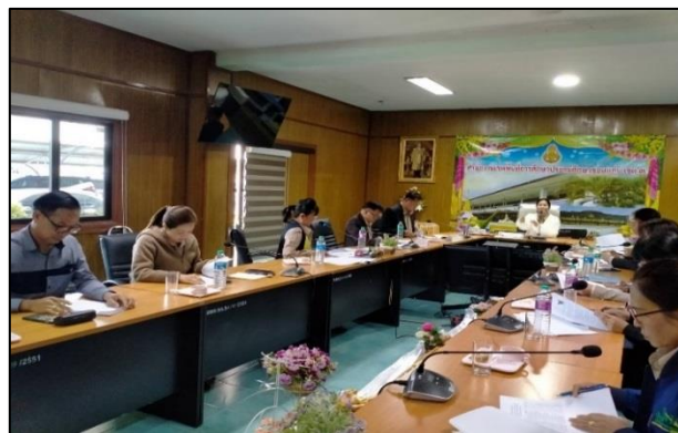
การพัฒนา "ครูผู้ช่วย สู่ครูมืออาชีพ" (7-8 ก.พ.67)